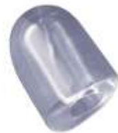
17 gr HOLLOW ICE CUBE